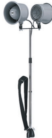
als Trägergarnitur (FüÙe abgeschraubt)